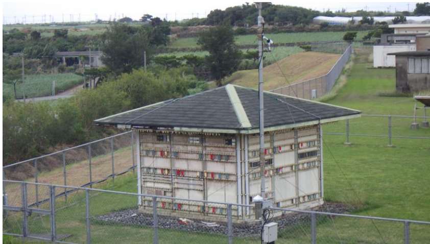
実際の構造物に模した暴露試験