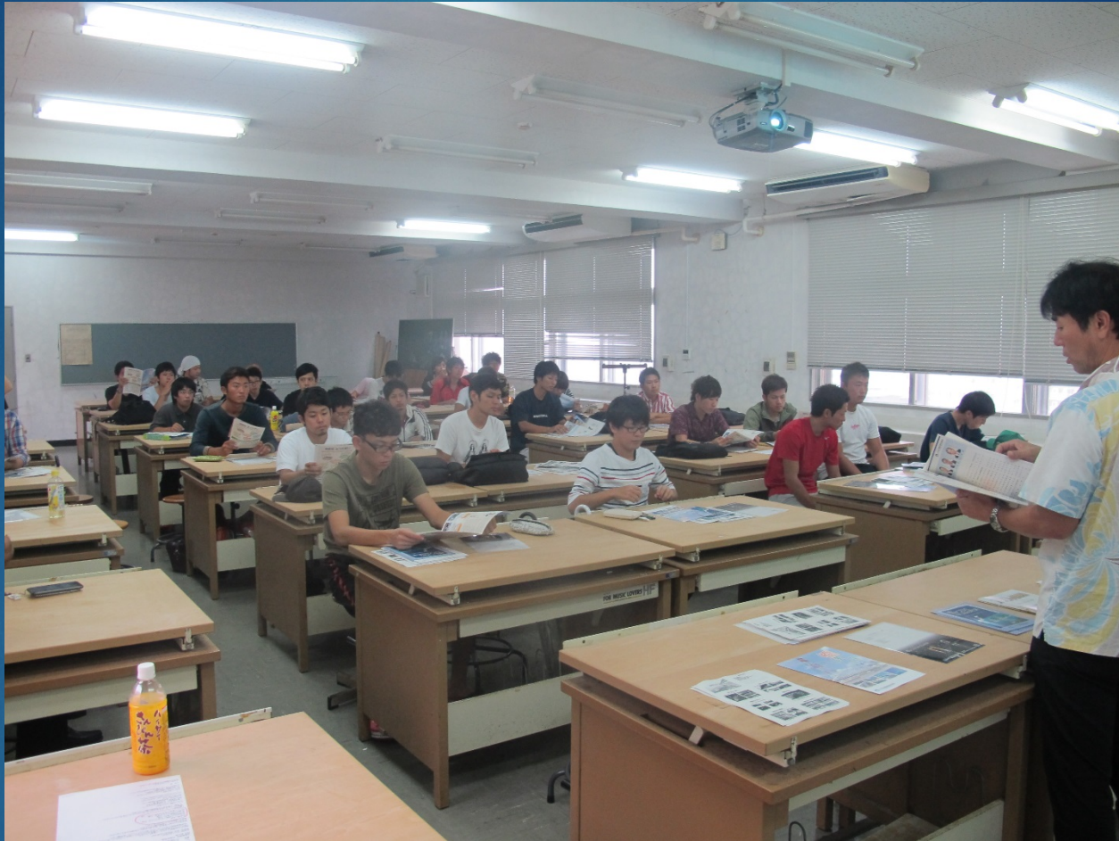
設計演習 I の生徒と構造工学研究室の生徒たち