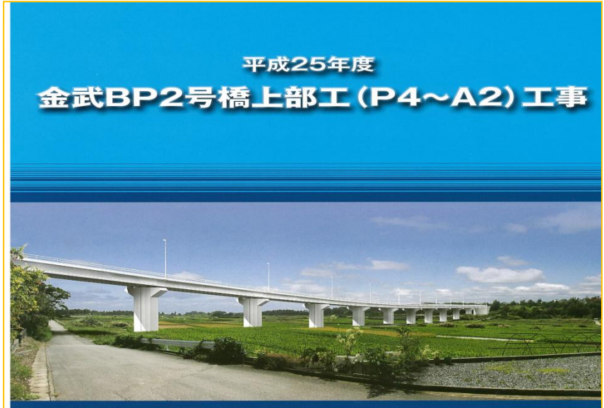
平成25年度 金武BP2号橋上部工(P4~A2)工事