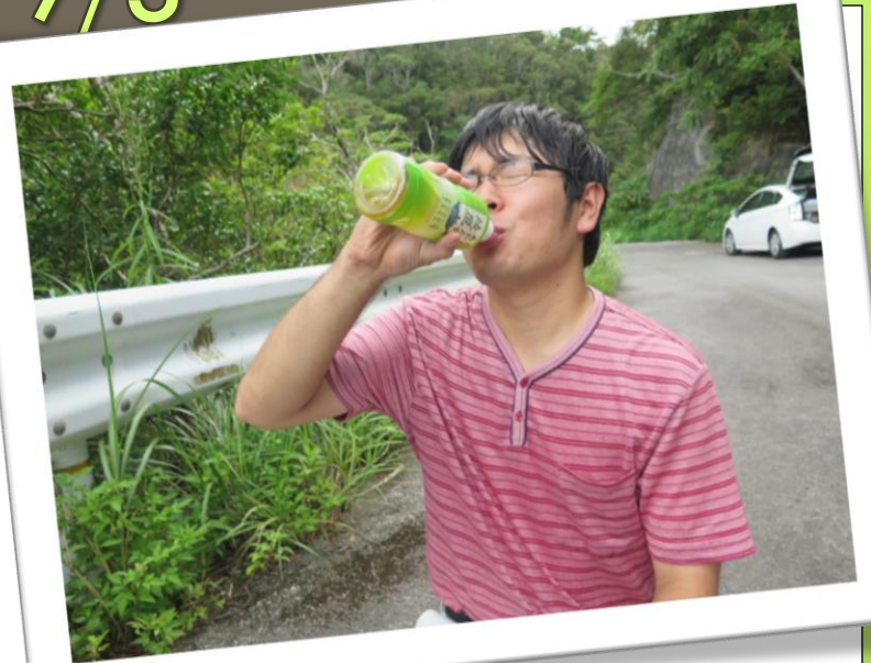
水流さん午前中お疲れ様です!!