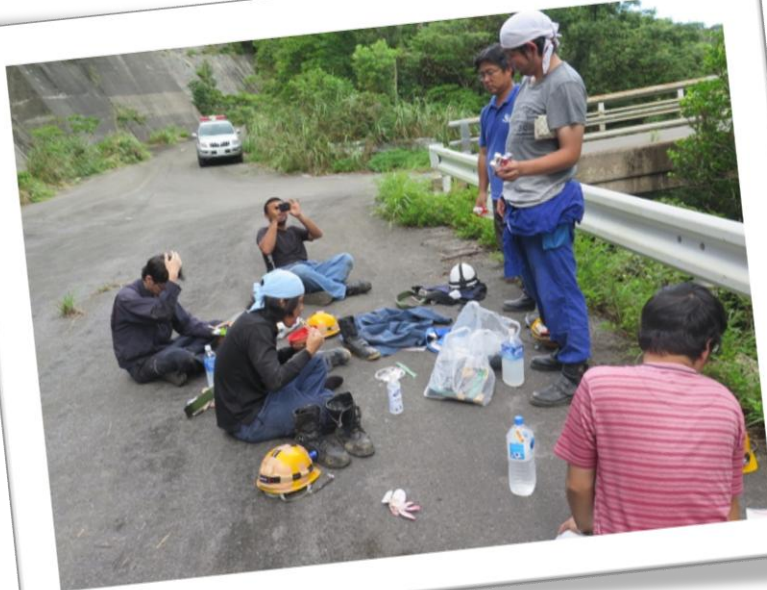
昼休憩、みんな午後も頑張って!