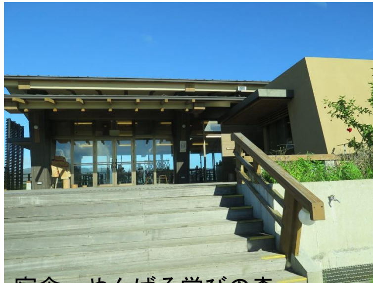
宿舎 やんばる学びの森