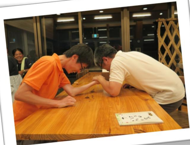
塚原君筋トレしないとね(笑)