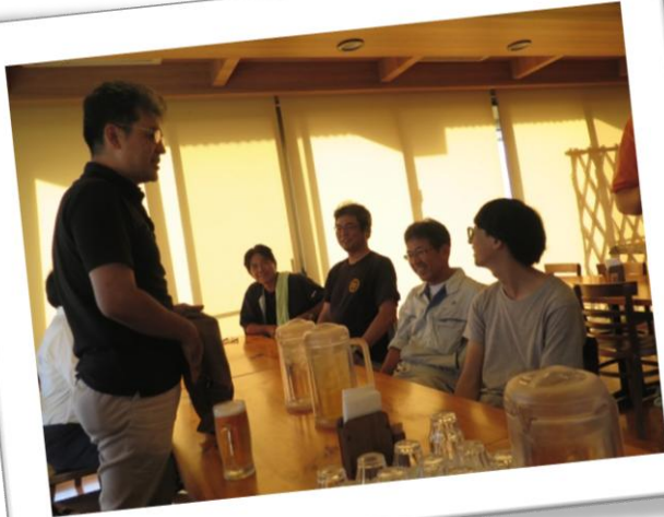
下里先生からのお話！