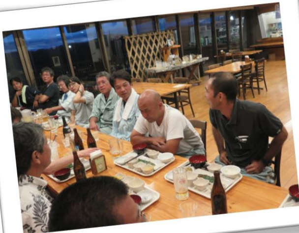
沖総局の皆さんご協力ありがとうございました