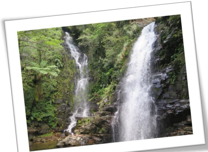
満水時にしか見れない滝!!!!