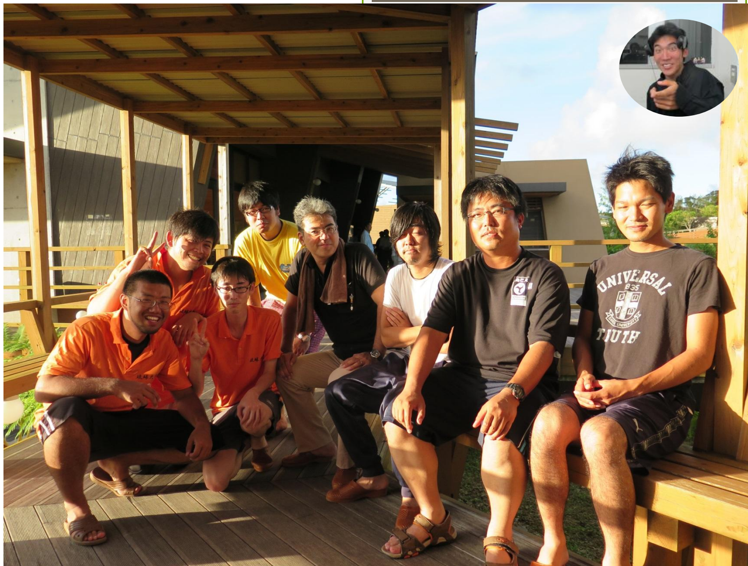
H26年度 琉球大学 構造研究室 集合写真