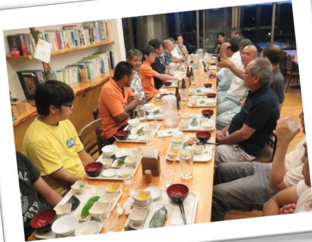
みんなで楽しくおしゃべり中