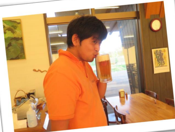
何かした後のビールは最高です!!(笑)