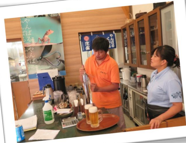
居酒屋アルバイト経験が 活かされている!!