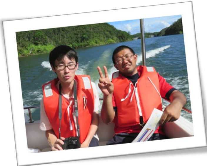
船でダム湖を見学！